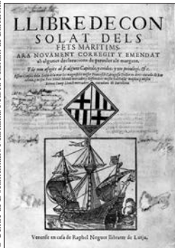
Llibre del Consolat de Mar, compilation de lois maritimes rédigée au XIV e siècle