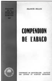
Traité de mathématiques de François Pellos, imprimé en 1492, à Nice. Ed. de la Revue des Langues Romanes, 1967.

Le développement de ces conventions d'écriture n'empêche pas le maintien de quelques caractéristiques dialectales (on trouve, dans les manuscrits, aussi bien des formes nord occitanes comme chantar que des formes sud occitanes comme cantar ; des formes occidentales comme dreit que des formes orientales comme drech ).