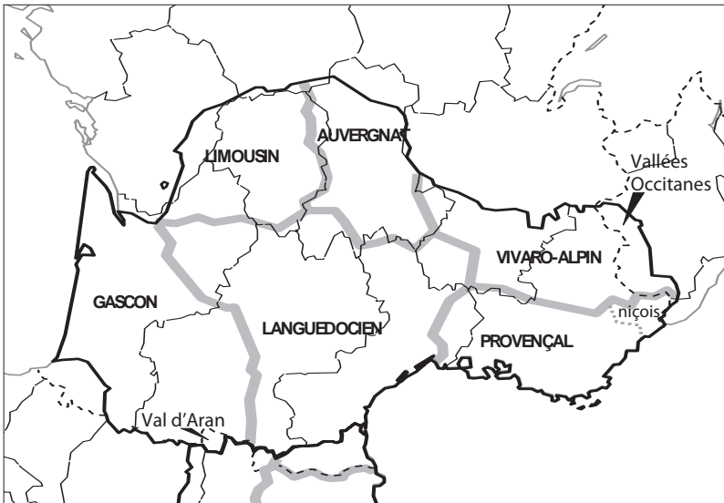
Carte linguistique de l'occitan

L es locuteurs naturels de l'occitan sont parfois les premiers à faire une différence entre ce qu'ils nomment leur « patois » local et « l'occitan », qu'ils voient comme une langue lointaine et académique. En fait, le concept d' occitan englobe aussi bien les parlers locaux que la variété dite standard. Mais la grande question pour les Occitans est celle de la conscience linguistique. La plupart des locuteurs ont été pendant des siècles et sont encore des « Occitans sans le savoir, Occitans sens o saber » comme dit l'écrivain Jean Boudou.